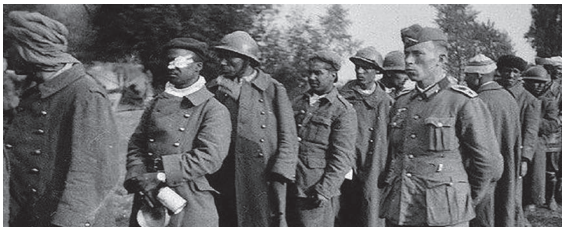
Tirailleurs sénégalais faits prisonniers par l'armée allemande au printemps 1940.

485 000 soldats enrôlés dans tout l'empire colonial furent envoyés au front. Ils tombèrent massivement à Verdun en 1916, lors de l'offensive du Chemin des Dames en 1917 et pour la prise de la ville de Reims en 1918. Sur les 134 000 tirailleurs sénégalais envoyés en Europe, plus de 20 % périrent, sur les champs de bataille et dans l'horreur des tranchées d'abord, et aussi du fait de toutes les maladies pulmonaires qui leur étaient inconnues