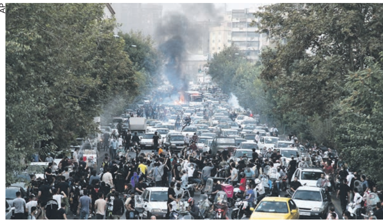
Téhéran, septembre 2022.