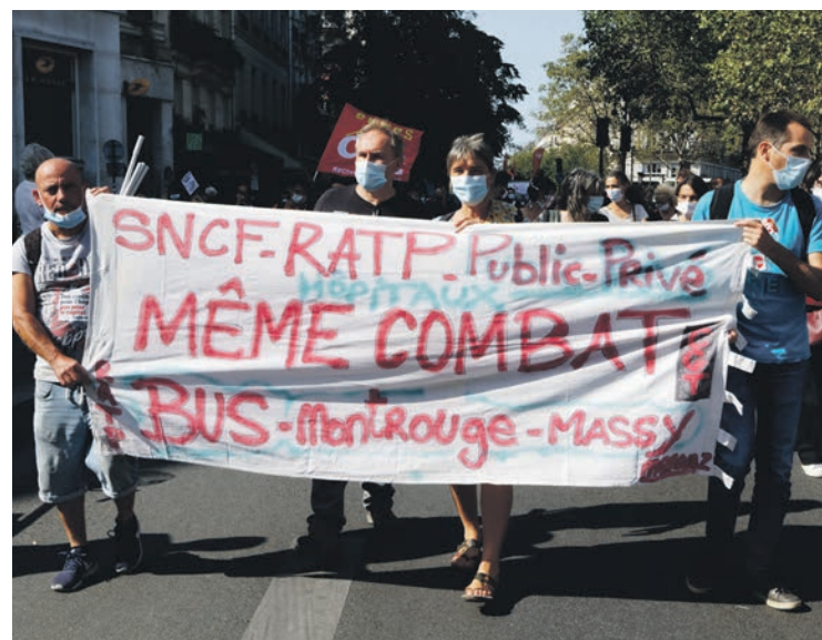
En septembre 2020, à Paris.

La direction espère que cet accord va la sortir de la situation où sa politique l'a menée, avec une hausse des démissions et des grèves. Direction et gouvernement craignent qu'un mouvement important de grève n'éclate dans les bus RATP, comme à Transdev ou à Keolis, mis sous pression de façon similaire. Cette signature syndicale leur redonne l'espoir de faire accepter aux