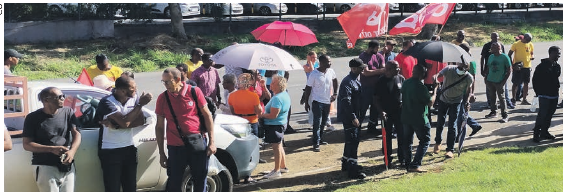
Meeting devant l'usine de production EDF à Jarry mardi matin 10 janvier.