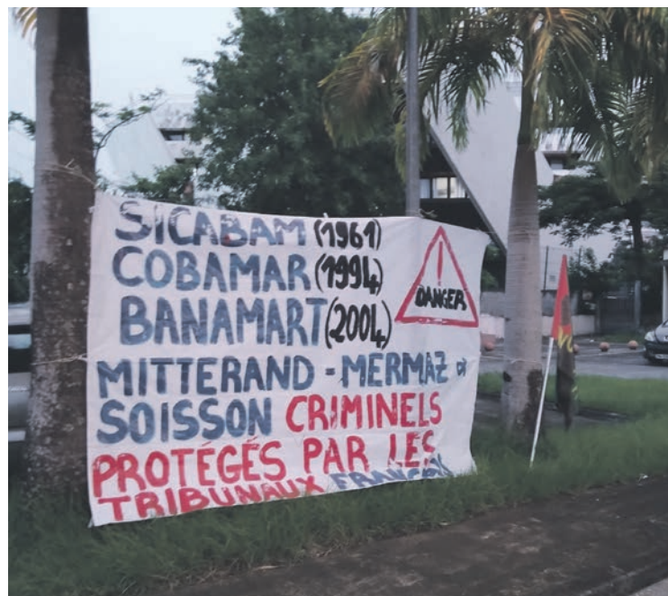
Dans la cour de la maison des syndicats à Fort de France.