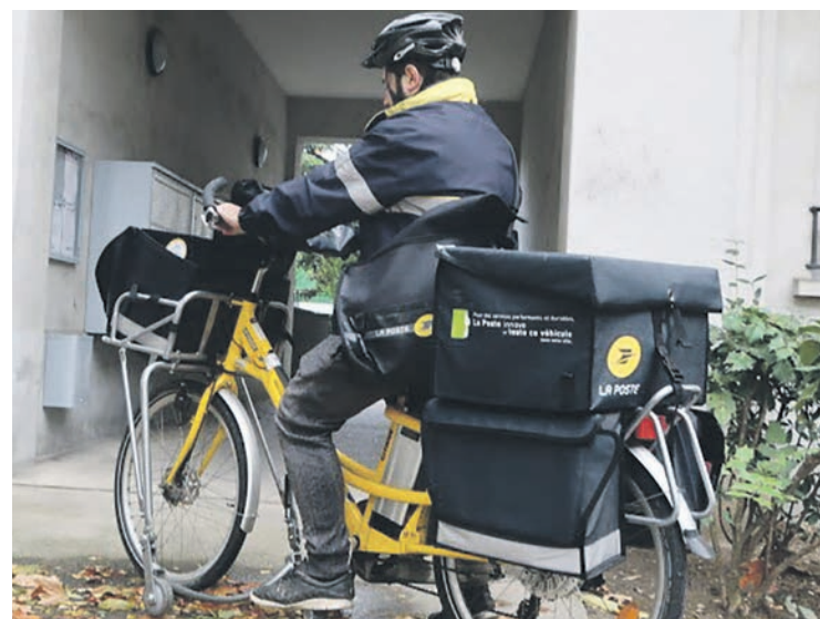
YANNICK PONNET LE PROGRÈS

et aussi dans tout le réseau de transport du courrier. Une nouvelle saignée est donc programmée par La Poste, qui cache cet objectif derrière des alibis plus que douteux. Ainsi, le fait que le timbre rouge ne représente désormais qu'une infime partie du courrier n'explique en rien que la distribution des lettres timbrées en vert soit aussi retardée, passant de deux à trois jours après leur dépôt. De même, la diminution, certes réelle, du courrier papier remplacé par Internet ne justifie pas les restructurations et leur cortège de suppressions d'emplois. Celles-ci vont bien au-delà de cette