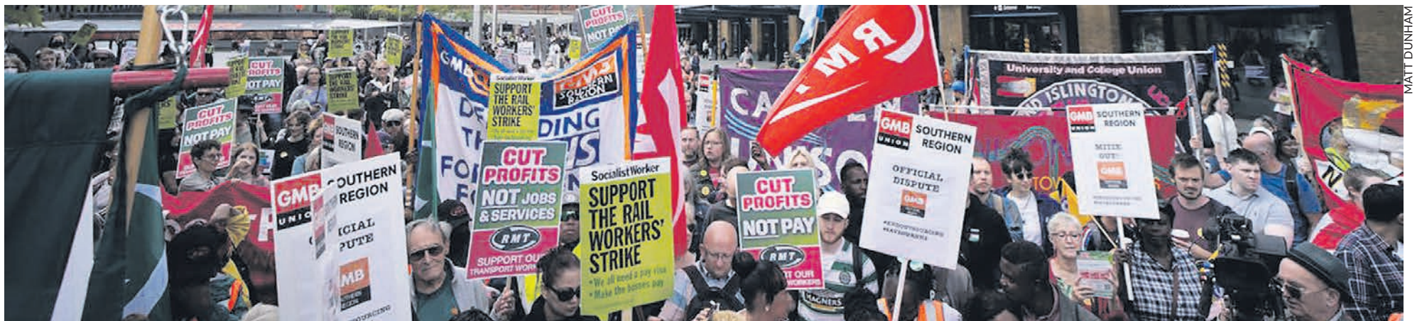
Grève des travailleurs du rail en juin 2022.