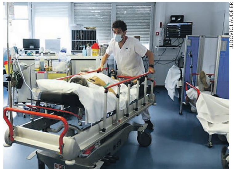
Aux Urgences du CHU de Besançon.