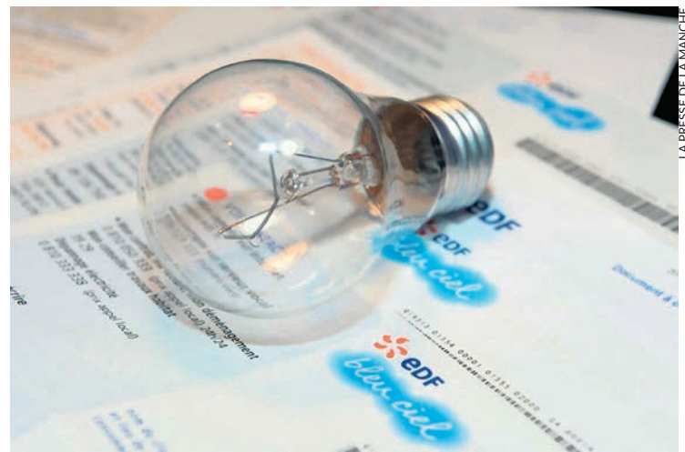
LA PRESSE DE LA MANCHE