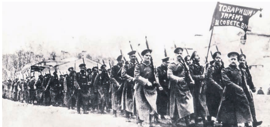
Gardes rouges en 1918.