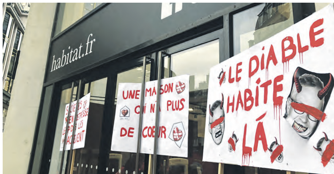
SV ACTU PARIS

Les travailleurs rejettent ces nouvelles fermetures annoncées. Ils dénoncent le rôle de prédateur d'un patron spécialiste de la liquidation d'entreprises. Ainsi, en quelques mois en 2023, il a fermé 26 magasins d'habillement Burton of