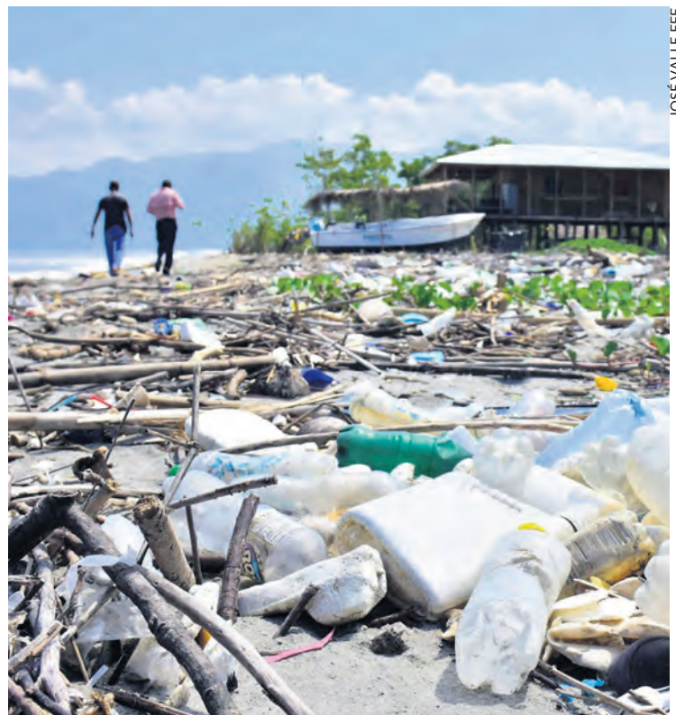
La rivière Motagua au Guatemala.