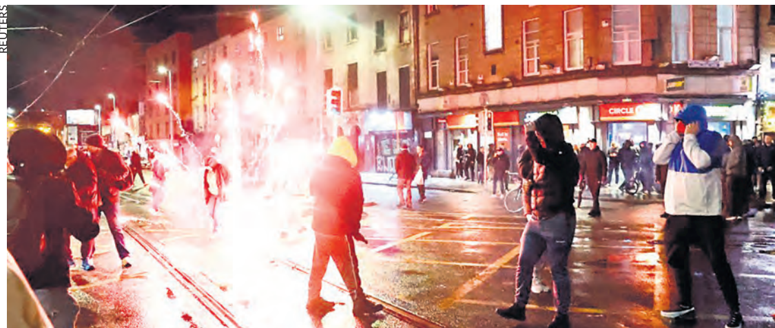
Manifestation anti-migrants, à Dublin, jeudi 23 novembre.