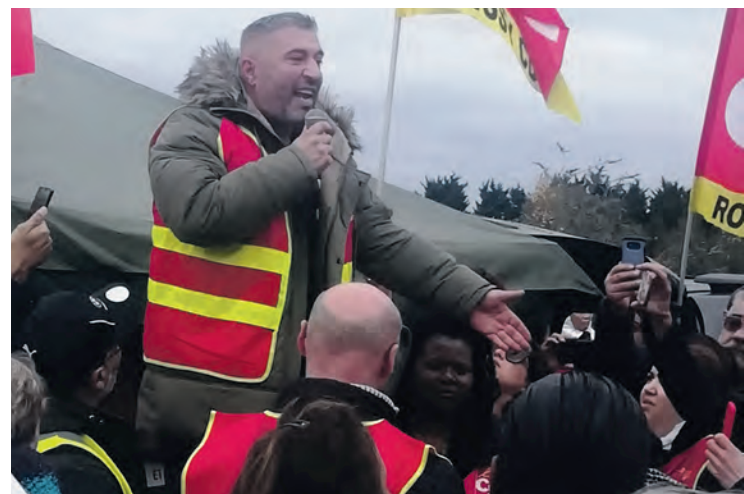
L'un des militants visés, à Roissy, le 24 novembre.