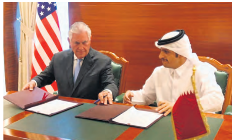
Le secrétaire d'État des USA et son homologue qatari, en 2017.

Malgré les guerres et les révoltes populaires qui ont secoué cette région depuis