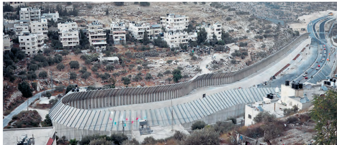
Sur la route 60, dite route des tunnels, la section longeant Bethléem est interdite aux Palestiniens.