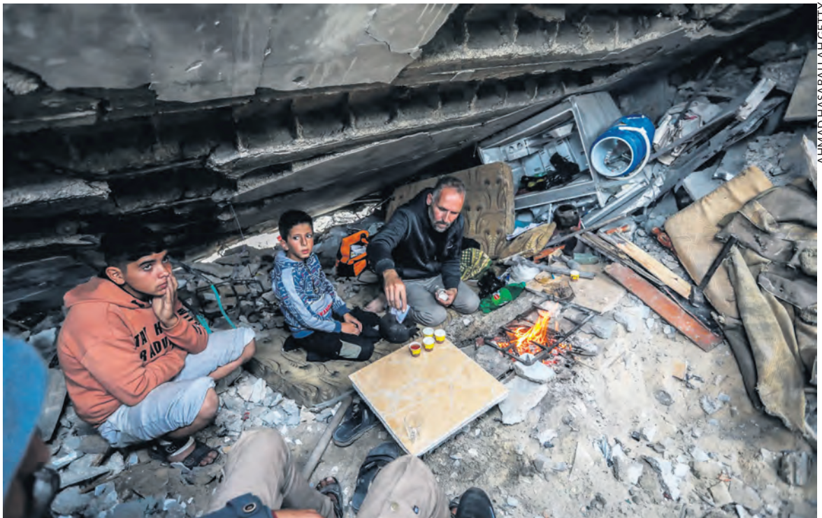
Dans les gravats à Khan Younes.

40 000 tonnes d'explosifs ont été déversées sur la population palestinienne. La moitié des bâtiments ont été détruits. 1,7 million de personnes ont été déplacées, sur les 2,4 millions d'habitants.