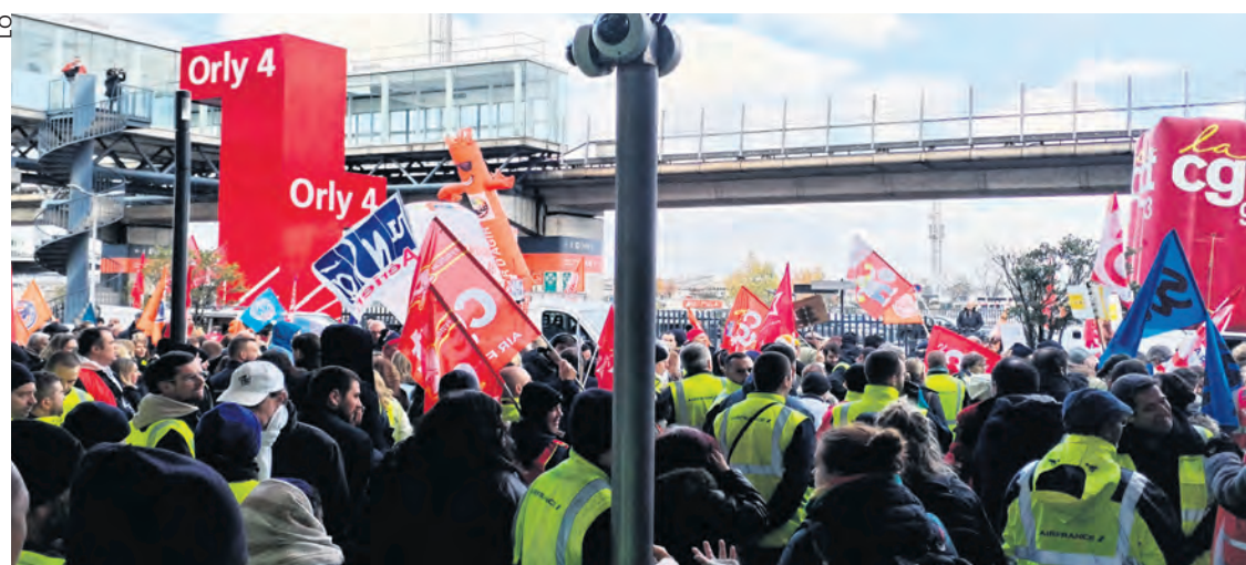
Le 28 novembre, à Orly.