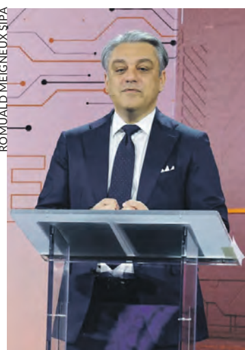
Luca De Meo.