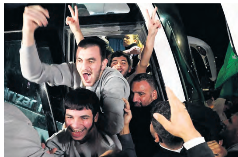
Des prisonniers palestiniens libérés, à leur retour à Beitonia, près de Ramallah, en Cisjordanie.