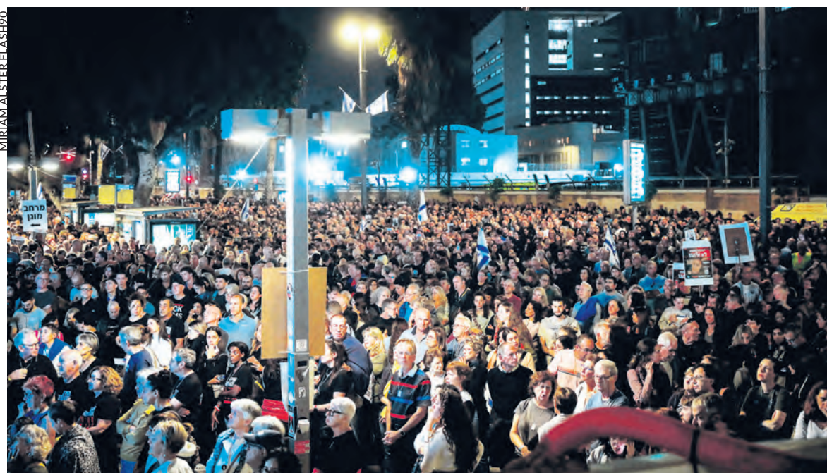
Rassemblement pour de la libération des otages, le 25 novembre, à Tel Aviv.