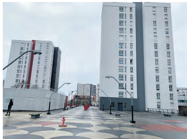
Immeubles gérés par Argenteuil-Bezons Habitat, au Val-d'Argent Nord.

aux locataires. Ils se sont aussi adressés au personnel du bailleur social ABH réuni à propos d'un problème de convention collective. Ils ont maintenu des liens avec les gardiens des immeubles dans lesquels ils travaillaient et ont réussi parfois à discuter avec d'autres travailleurs repris par EDS, qui leur ont exprimé leurs encouragements. Ils ont même pu mesurer les difficultés du reprenneur à faire faire le travail sans eux. Chaque fois, alors qu'ils viennent de tous les pays, ils ont réussi à passer les obstacles de la langue pour trouver les mots, toucher et, au final, rencontrer un accueil chaleureux.