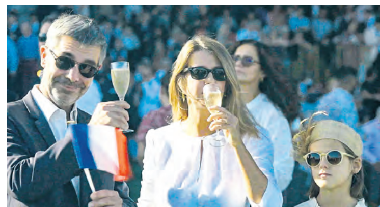
Le monde merveilleux des ultra-riches.

Cette grosse différence de taux s'explique, selon les auteurs de l'étude, par le fait que les gros capitalistes