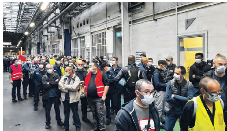
Lors d'un débrayage il y a deux ans à Rennes.